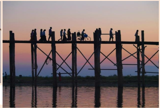
マンダレーの夕景