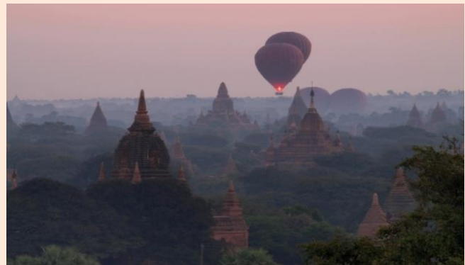
世界遺産バガンの仏塔