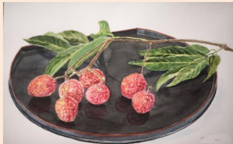
南国の果物/ライチ(水彩画)